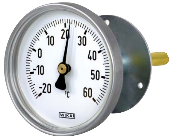
Биметаллический термометр модель A48.10.080