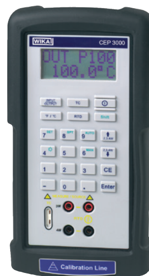
Multicalibrador portátil modelo CEP3000