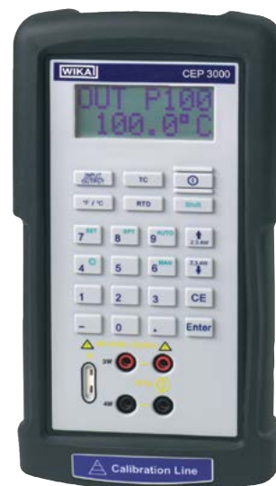
Przenośny kalibrator temperatury model CEP3000

Istnieje szeroki zakres możliwych aplikacji kalibratora CEP3000. Może być stosowany do kalibracji w przemyśle (laboratoria, produkcja, warsztaty), w firmach oferujących usługę kalibracji i w przemyśle usługowym, jak również do zapewnienia jakości.